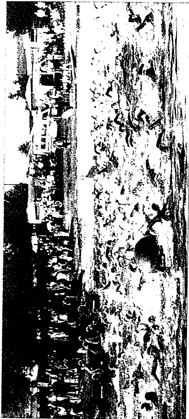
Kein ungetriebenes Badevergnügen, denn der Riegeler Baggersee ist nicht geheizt – doch für die Starter des Breisgau-Triathlon in Malterdingen geht es sowieso um Sekunden...